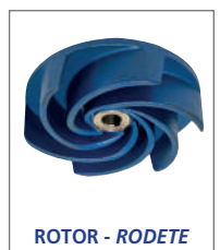
ROTOR - RODETE